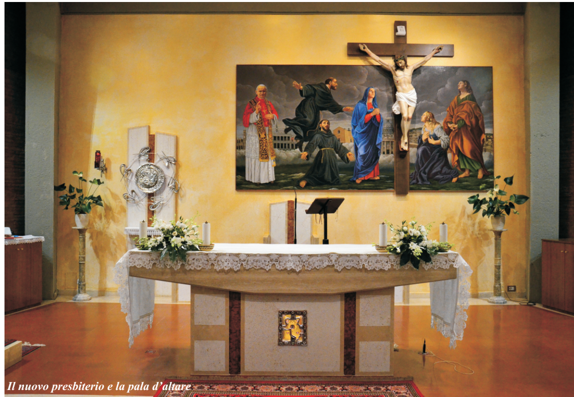
Il nuovo presbiterio e la pala d'altare